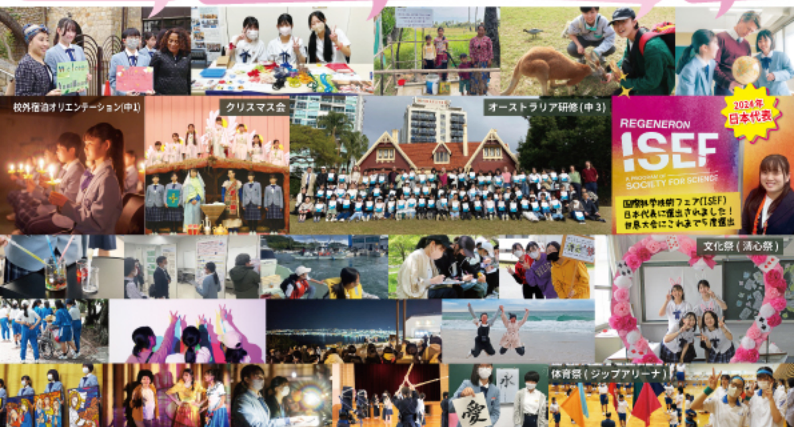
校外宿泊オリエンテーション(中1)